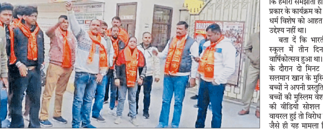
अंबाला। स्कूल के बाहर प्रदर्शन करते हिंदू संगठन के कार्यकर्ता।

हरिभूमि न्यूज ►► अंबाला भारतीय पब्लिक स्कूल के वार्षिकोत्सव में बच्चों को एक एकट के दौरान मुस्लिम बनाने के मामले ने तूल पकड़ लिया है। सोमवार को इसके विरोध में हिंदू संगठनों के लोग एकजुट हो गए। सनातन टास्क फोर्स के सदस्यों ने एकजुट होकर जमकर नारेबाजी की। इस विरोध को देखते हुए स्कूल